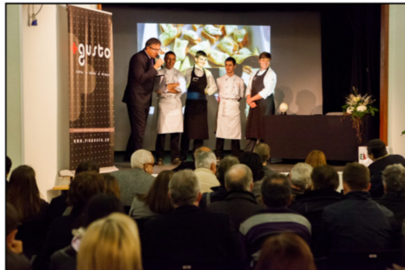
Walter Miori, chef trentino più volte insignito della prestigiosa stella Michelin, ha illustrato le proprietà della carne di struzzo in cucina e le molteplici possibilità di impiego. Presenti anche i ragazzi della Scuola Alberghiera di Levico.